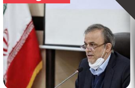
بیش از ۵ میلیارد دلار صادرات غذایی داریم

وزیر صنعت، معدن و تجارت عصر شنبه ۱۳ دی ماه در آئین افتتاح طرح‌های توسعه گروه صنایع غذایی شیرین عسل با تاکید بر اینکه وظیفه شرعی است به کارآفرینان کمک کنیم، افزود: در کشور ما صنایع غذایی پتانسیل بالایی دارد، به‌طوری‌که بالغ بر پنج میلیارد دلار داریم که به برکت وجود و تلاش مجاهدان اقتصادی است.