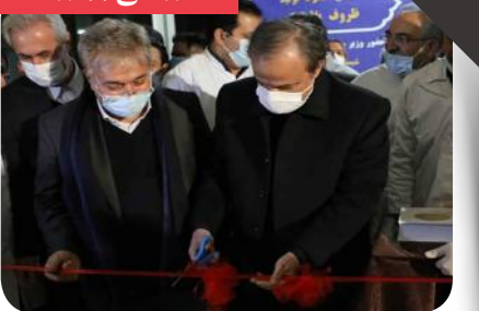
طرح‌های توسعه گروه صنایع غذایی شیرین عسل در شبستر افتتاح شد

در دومین روز از سفر وزیر صنعت، معدن و تجارت به آذربایجان شرقی و در آخرین ساعات حضور او در این استان، طرح‌های توسعه گروه صنایع غذایی شیرین عسل افتتاح شد. این طرح‌ها شامل خطوط تولید درآژه شکلاتی، تافی، کیک، شیر، آبیوه تتراپک، ورق پلاستیکی، ترمو فمینگ و ظروف پلاستیکی است.