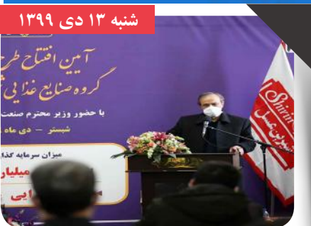
سه‌م صنایع غذایی ایران از صادرات کشور پنج میلیارد دلار است

وزیر صنعت، معدن و تجارت گفت: صادرات سالانه صنایع غذایی ایران به پنج میلیارد دلار رسیده است و افزایش آن تا ۱۰ میلیارد دلار نیز دور از ذهن نیست. علیرضا رزم حسینی در مراسم افتتاح طرح و فرآورده‌های جدید شرکت شیرین عسل اظهار کرد: صنایع مواد غذایی در ایران توسعه و پیشرفت خوبی پیدا کرده.