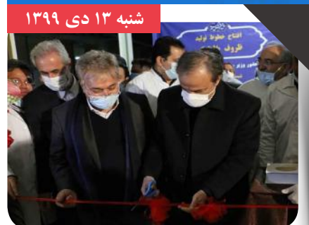
طرح‌های توسعه گروه صنایع غذایی شیرین عسل در شبستر افتتاح شد

در دومین روز از سفر وزیر صنعت، معدن و تجارت به آذربایجان شرقی و در آخرین ساعات حضور او در این استان، طرح‌های توسعه گروه صنایع غذایی شیرین عسل افتتاح شد. این طرح‌ها شامل خطوط تولید درآژه شکلاتی، تافی، کیک، شیر، آبیوه تتراپک، ورق پلاستیکی، ترمو فمینگ و ظروف پلاستیکی است.