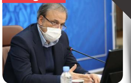
صادرات ۵ میلیارد دلاری صنایع غذایی از کشور

وزیر صنعت، معدن و تجارت، از صادرات ۵ میلیارد دلاری صنایع غذایی در کشور خبر داد و گفت: در گام دوم انقلاب به دنبال اقتصادی قوی برای خانوارهای شهری و روستایی هستیم. علیرضا رزم حسینی اظهار داشت: ظرفیت و پتانسیل برای صادرات صنایع غذایی تا ۱۰ میلیارد دلار نیز امکان پذیر می‌باشد.