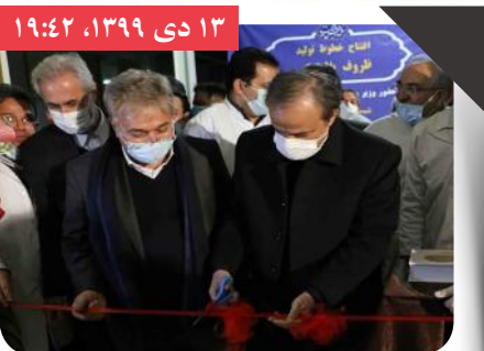
سه‌م صنایع غذایی ایران از صادرات کشور پنج میلیارد دلار است

وزیر صنعت، معدن و تجارت گفت: صادرات سالانه صنایع غذایی ایران به پنج میلیارد دلار رسیده است و افزایش آن تا ۱۰ میلیارد دلار نیز دور از ذهن نیست. علیرضا رزم حسینی روز شنبه در مراسم افتتاح طرح و فرآورده‌های جدید شرکت شیرین عسل اظهار کرد: صنایع مواد غذایی در ایران توسعه و پیشرفت خوبی پیدا کرده.